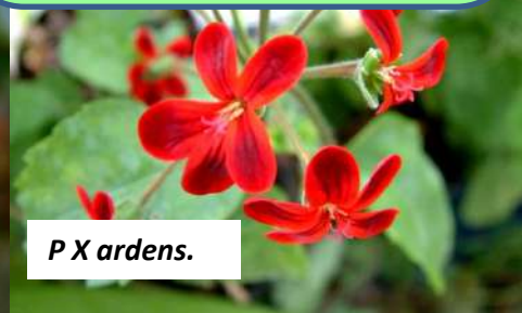
P X ardens.

Section Polyactium (Eckl. & Zeyh.) DC. Polyactium se rapporte à la forme d'étoile des inflorescences à fleurs nombreuses de la plupart des espèces de cette section. Les plantes ont généralement un tubercule souterrain et des tiges pérennes réduites au dessus du sol.