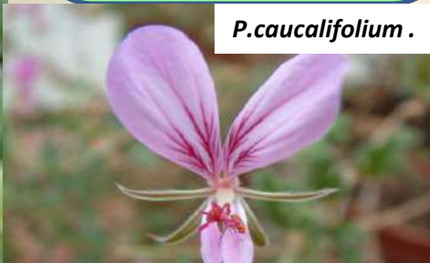
P. caucalifolium .

Cette section comprend des sous-arbrisseaux pérennants, à tiges minces et diffuses, ou des plantes annuelles herbacées. Les espèces de cette section n'ont jamais de tubercules, les tiges sont enflées et succulentes, mais elles ne portent pas d'épines.