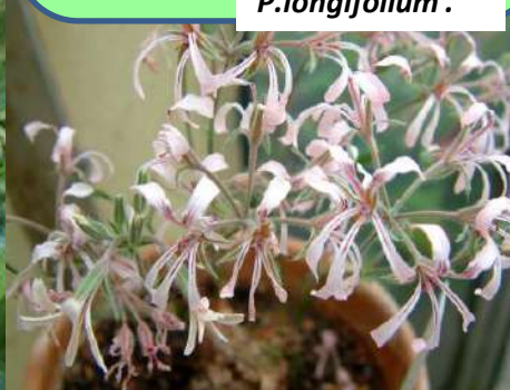
P. longifolium .

Section Hoarea DC. Les plantes jamais annuelles de cette section sont pérennantes « par tiges », ayant entre 1 et 3 tubercules, celui-ci souvent en forme de navet. Elles sont dormantes pendant une partie de l'année.