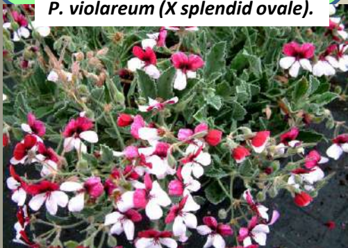
P. violareum (X splendid ovale).

Toutes les espèces de cette section sont petites et sans tubercules avec les tiges courtes à très courtes et dressées, parfois enflées et succulentes, mais avec des stipules ou des pétioles persistants.