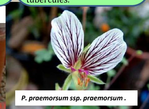
P. praemorsum ssp. praemorsum .

Les plantes appartenant à cette section sont des herbes annuelles ou des sous-arbrisseaux à tiges ligneuses ou herbacées rarement avec des tubercules.