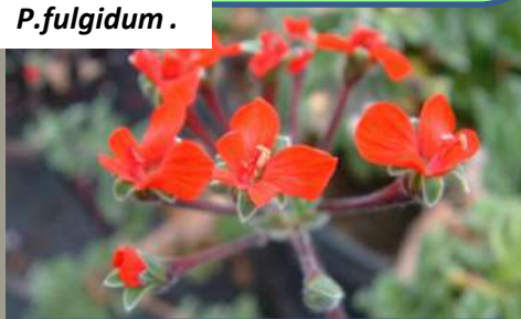
P. fulgidum .

Harv. Les espèces de cette section sont pérennes avec des tiges plus ou moins ramifiées, succulentes et qui sont généralement ligneuses à la base, rarement tubéreuses, épineuses ou avec des stipules ou des pétioles persistants.