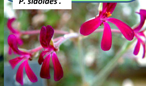
P. sidoides .

Plantes pérennes, sans tubercules et sans tiges succulentes ou épaisses, habituellement avec des stipules ou des pétioles persistants. Les feuilles sont aromatiques et persistantes, parfois glauques.