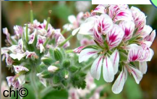
P. minimum .

Section Polyactium (Eckl. & Zeyh.) DC. Polyactium se rapporte à la forme d'étoile des inflorescences à fleurs nombreuses de la plupart des espèces de cette section. Les plantes ont généralement un tubercule souterrain et des tiges pérennes réduites au dessus du sol.